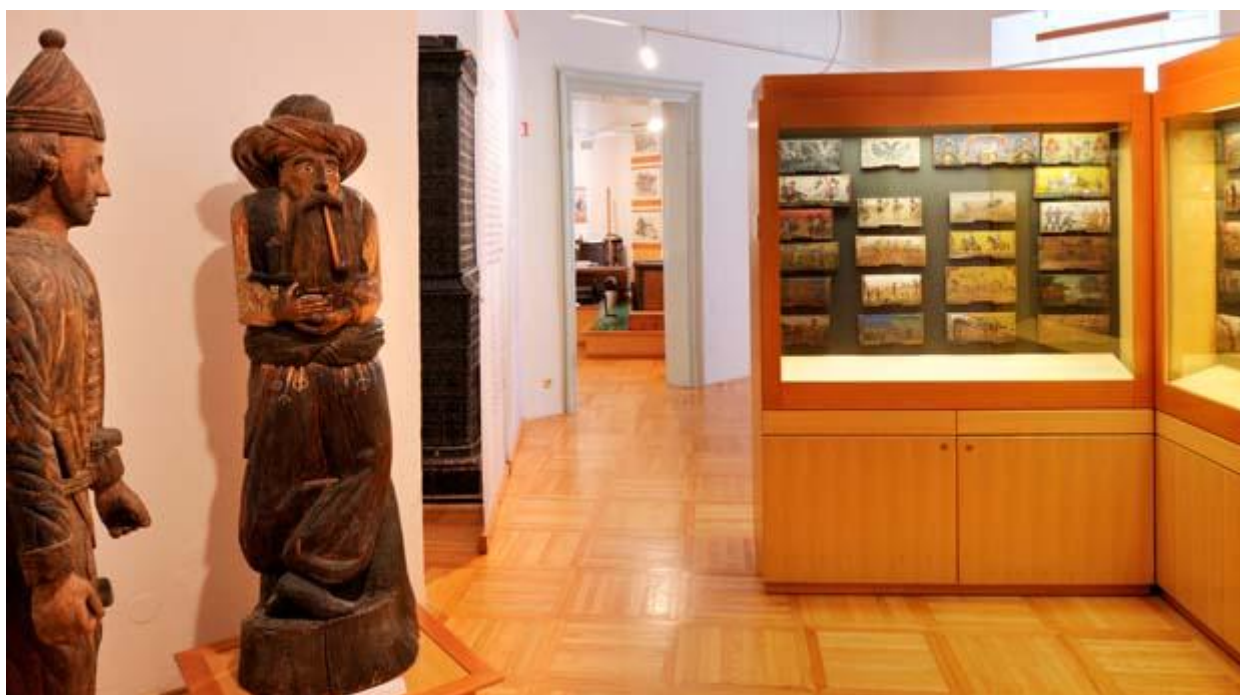
(Το μουσείο μελισσοκομίας της Σλοβενίας)