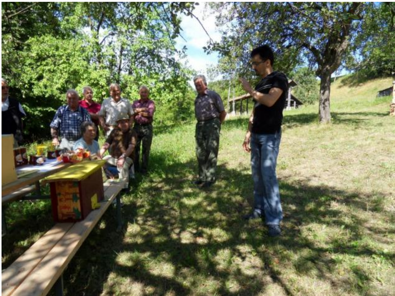
(Μια πρώτη γνωριμία με τον κόσμο των μελισσών)

πληροφορίες στους μελισσοκόμους σχετικά με τις θέσεις και τις εντάσεις της ροής!!! Όπως όμως συμβαίνει και στην Ελλάδα, έτσι και στη Σλοβενία υπάρχουν στα δάση πολλές διάσπαρτες κυψέλες παρατήρησης που παρέχουν πληροφορίες σχετικά με τις ποσότητες μελιού που συλλέγουν οι μέλισσες. Η διαφορά είναι ότι εκεί υπάρχει γενική ενημέρωση και έτσι όλοι οι μελισσοκόμοι είναι σε θέση να αποφασίσουν πότε θα μετακινήσουν τα μελίσσια τους.