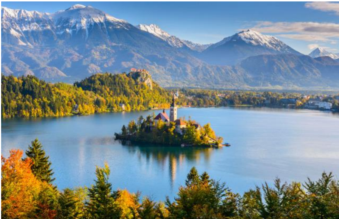
(Η λίμνη Μπλεντ)

Στα μέσα του 18ου αιώνα μια μοναδική λαϊκή τέχνη, ζωγραφικής κυψέλης εμφανίστηκε στη Σλοβενία, η οποία ήταν τότε μέρος της Αυστριακής Αυτοκρατορίας. Αυτή ήταν μια περίοδος που η ζωγραφική αγροτικών αποθηκών, εργαλείων και επίπλων ήταν ευρέως διαδεδομένη πρακτική. Μπορεί κανείς να επισκεφθεί εργαστήρια ζωγραφικής κυψελών και να δει κυψέλες, όπως κοσμούνται παραδοσιακά, με θρησκευτικά θέματα και βιβλικά γεγονότα αλλά και καρτουνίστικες σκηνές από την καθημερινή ζωή του χωριού. Η ζωγραφική των κυψελών βοηθάει και τις μέλισσες να προσανατολιστούν ευκολότερα αλλά και τον μελισσοκόμο να ξεχωρίζει τα μελίσια του.