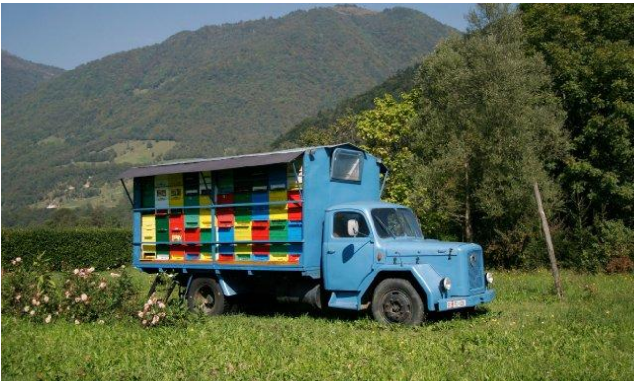
(Ένα κινητό μελισσοκομείο στην καρότσα ενός παλιού φορτηγού)